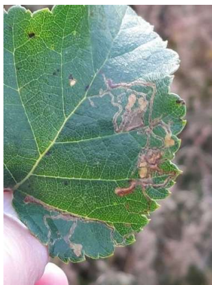
Sociale berkenmineermot, 11 oktober 2024