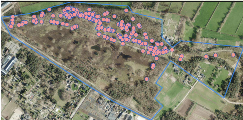
Figuur 4. Waarnemingen nachtvinders 2024 van de auteur.