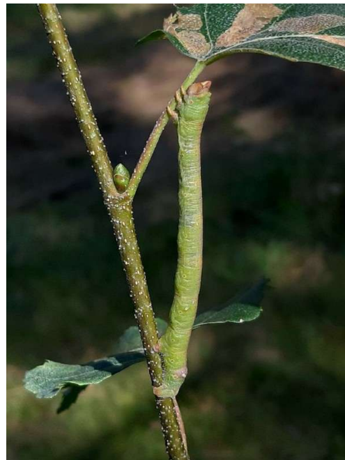
Peper- en zoutvlinder, 20 september 2024