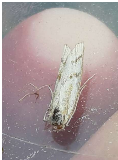
Moerasgrasmot, 30 augustus 2024