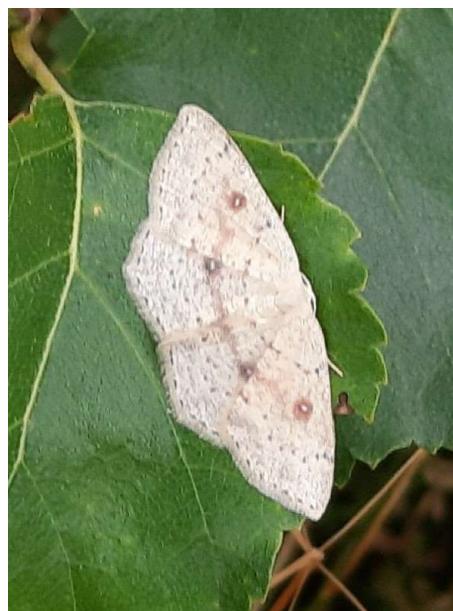
Berkenoogspanner, 30 augustus 2024