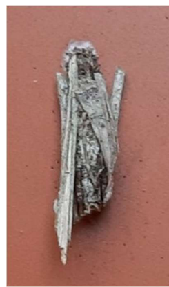
Gewone zakdrager, 3 januari 2024