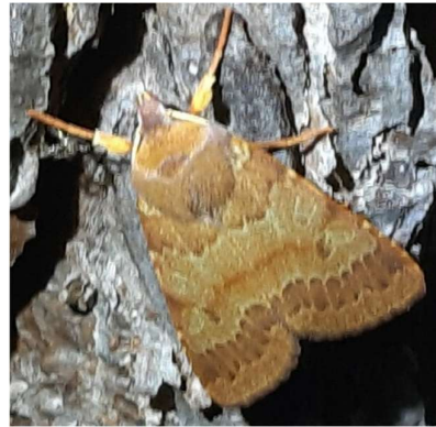
Roodachtige herfstuil, 20 september 2024