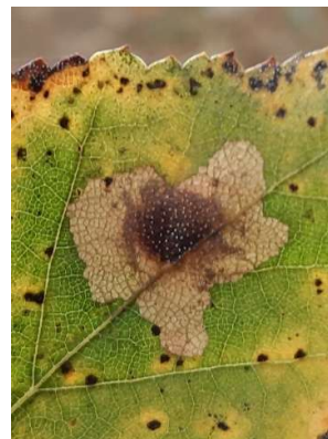
Ronde berkenblaasmijnmot, 18 oktober 2024