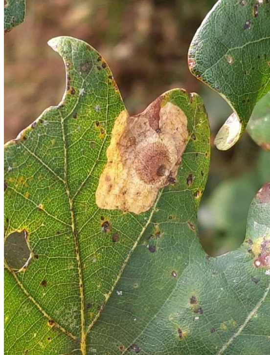
Hoefijzervlekpot (mijn), 27 september 2024