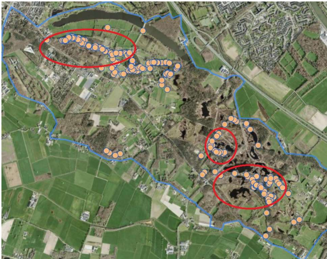
Figuur 2. Overasseltse en Hatertse Vennen (blauw) met globaal de drie onderzoeksgebieden in 2024 (rood). Vlnr: Munnekeveld, Hatertse Vennen-centraal (omgeving Eendenven), Hatertse Vennen-oost. In de figuur zijn alle dagvlinderwaarnemingen van de auteur in 2024 weergegeven (bolletjes).

In 2024 zijn de deelgebieden Munnekeveld, Hatertse Vennen-centraal (met name omgeving Eendenven) en Hatertse Vennen-oost onderzocht (figuur 2). De drie deelgebieden zijn vooral bezocht via de paden, waarnaast ook de meeste heideterreinen en graslanden zijn doorkruist. Per deelgebied zijn in dit rapport de waarnemingen in 2024 per soortgroep besproken. In de bijlagen 2 t/m 4 zijn alle waarnemingen vanaf het startjaar per soortgroep per deelgebied per jaar opgenomen.