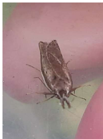
Gemsmot, 31 mei 2024