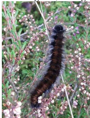
Veelvraat, 13 september 2024