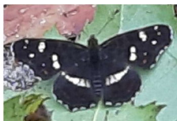
Landkaartje, 23 augustus 2024