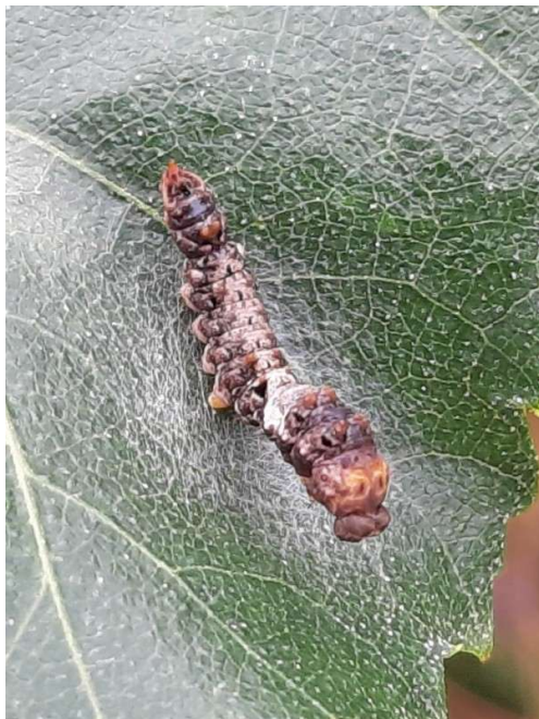
Bleke eenstaart, 13 september 2024