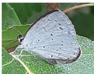
Boomblauwtje, 13 september 2024