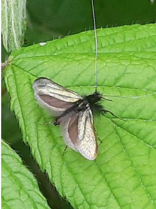
Smaragdlangsprietmot (m), 12 april 2024