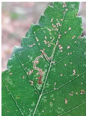
Zuidelijke berkenmineermot, 18 oktober 2024