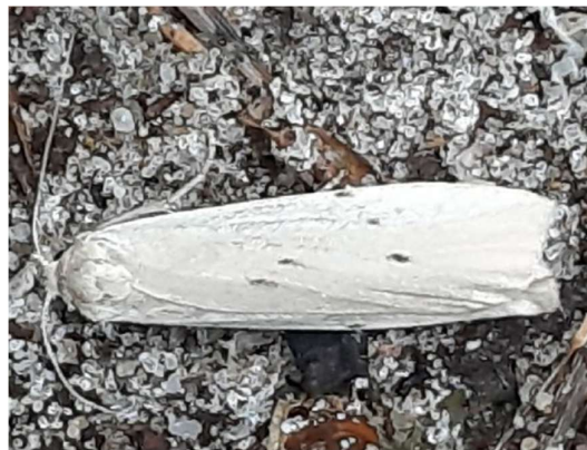
Muisbeertje, 5 juli 2024