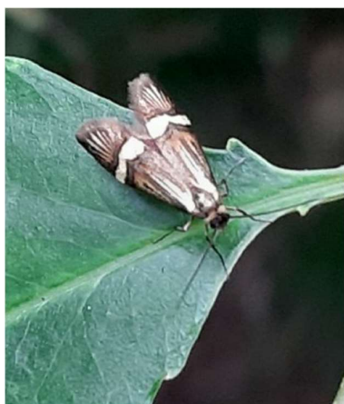
Geelbandlangsprietmot, 14 juni 2024

Veertien soorten werden voor 2024 op Hatertse Vennen-centraal niet eerder waargenomen: late purpermot, meidoornmineermot, geelbandlangsprietmot, vuilboomooglapmot, gewone zebarmot, hazelaarblaasmot, meidoornvouwmat, egale duifmot, voorjaarskortvleugelmot, smallijnbladroller, geisha, gewone dennenlotboorder, zilverstreepgrasmot en moerasgrasmot.