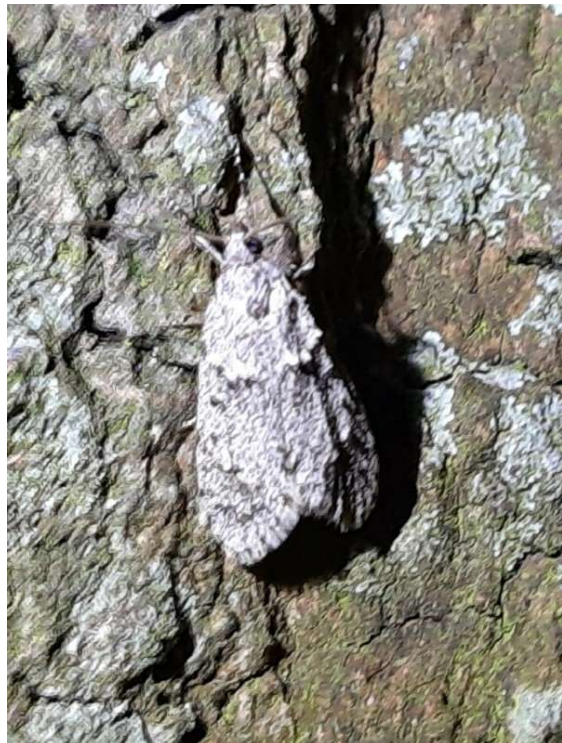
Voorjaarskortvleugelmot (m), 20 maart 2024