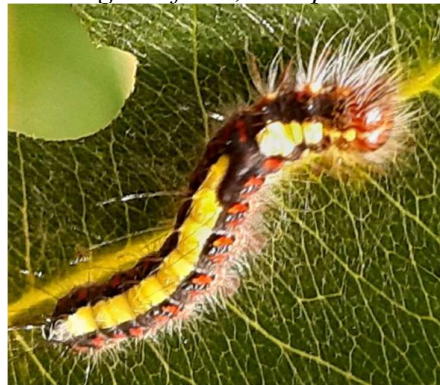
Psi-uil, 27 september 2024