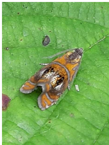
Geisha, 14 juni 2024