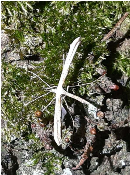
Windedermot, 20 september 2024