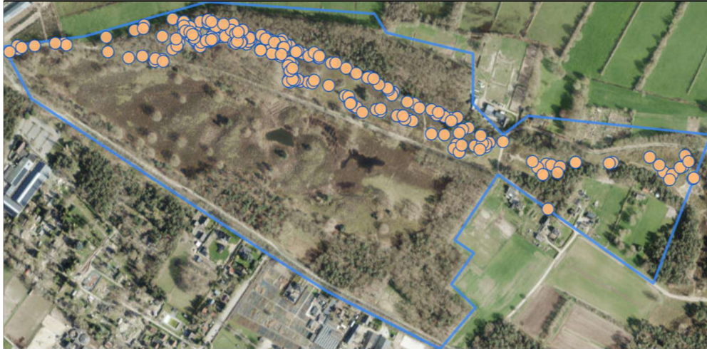
Figuur 3. Waarnemingen dagvlinders 2024 van de auteur.