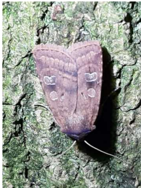
Gewone breedvleugeluil, 21 augustus 2024