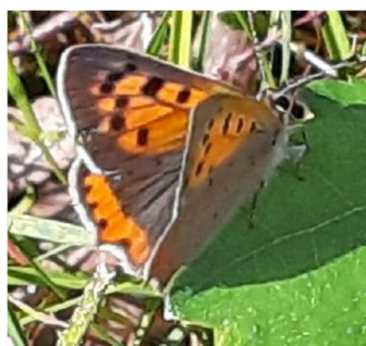
Kleine vuurvinder, 17 augustus 2024