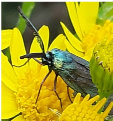
Metaalvlinder, 5 juli 2024

Zestien soorten werden voor 2024 op Hatertse Vennen-centraal niet eerder waargenomen: grote wintervlinder, zwartkamdwergspanner, grote voorjaarsspanner, berkenoogspanner, muisbeertje, witte grijsbandspanner, stro-uiltje, peper- en zoutvlinder, variabele eikenuil, tweestreepvoorjaarsuil, kleine voorjaarsuil, dubbelstipvoorjaarsuil, wachtervlinder, roodkopwinteruil, zwartvlekwinteruil en bosbesuil.