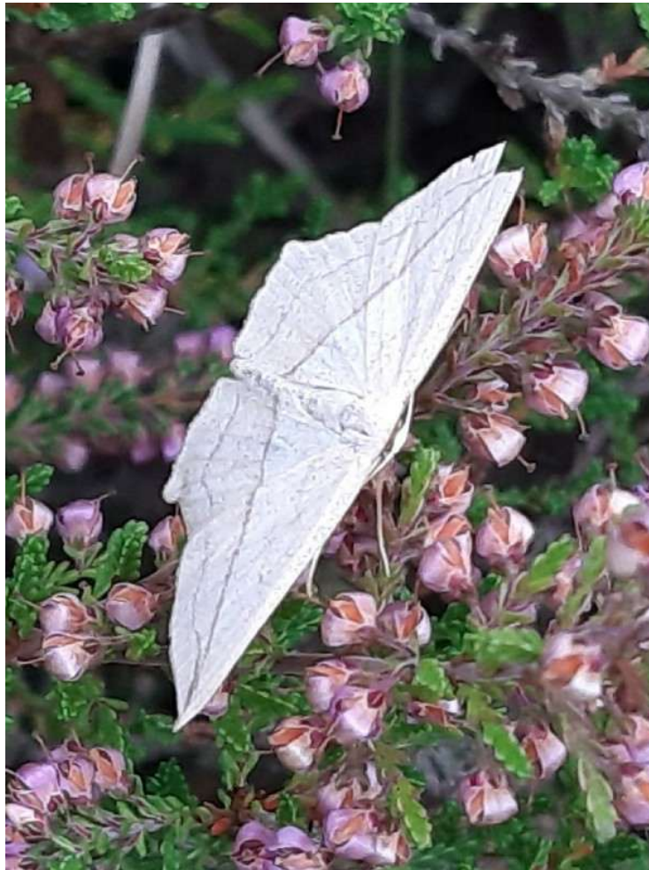
Lieveling, 23 augustus 2024, Munnekeveld

Overige publicaties: https://fauna-onderzoek-wijchen.nl/content/publicatielijst