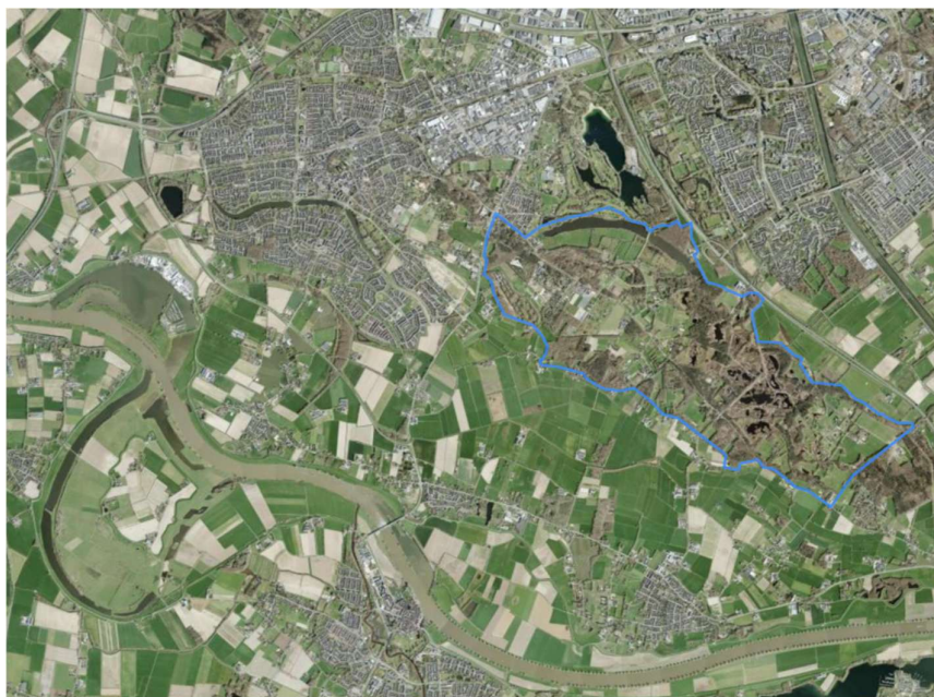
Figuur 1. Overasseltse en Hatertse Vennen (blauw) met ten noordoosten Wijchen, ten noordwesten Nijmegen en aan de zuidkant de Maas.

In dit rapport betreft het gebied de Overasseltse en Hatertse Vennen het gehele gebied van 8,29 km 2 (op basis van de gegevens van waarneming.nl) tussen Alverna (west) en Heide (oost) en tussen het Wijchens Ven (noord) en de Boskant-Zandbergseweg (zuid) (figuur 2). Het gebied is grotendeels in eigendom en beheer van Staatsbosbeheer, maar er zijn ook veel particuliere gronden. Het gebied is een afwisseling van bos (grove den, zomereik), vennen, heide en extensieve landbouwgrond.