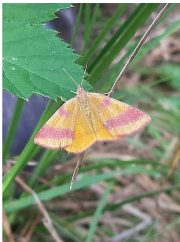
Zuringspanner, 17 augustus 2024, Hatertse Vennen-oost