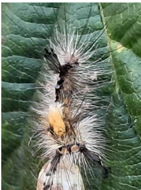
Witvlakvlinder, 30 augustus 2024

Twee soorten werden voor 2024 op Hatertse Vennen-oost niet eerder waargenomen: witvlakvlinder en bruine sikkelui.