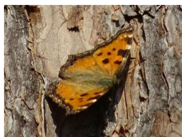
Grote vos, 8 maart 2024