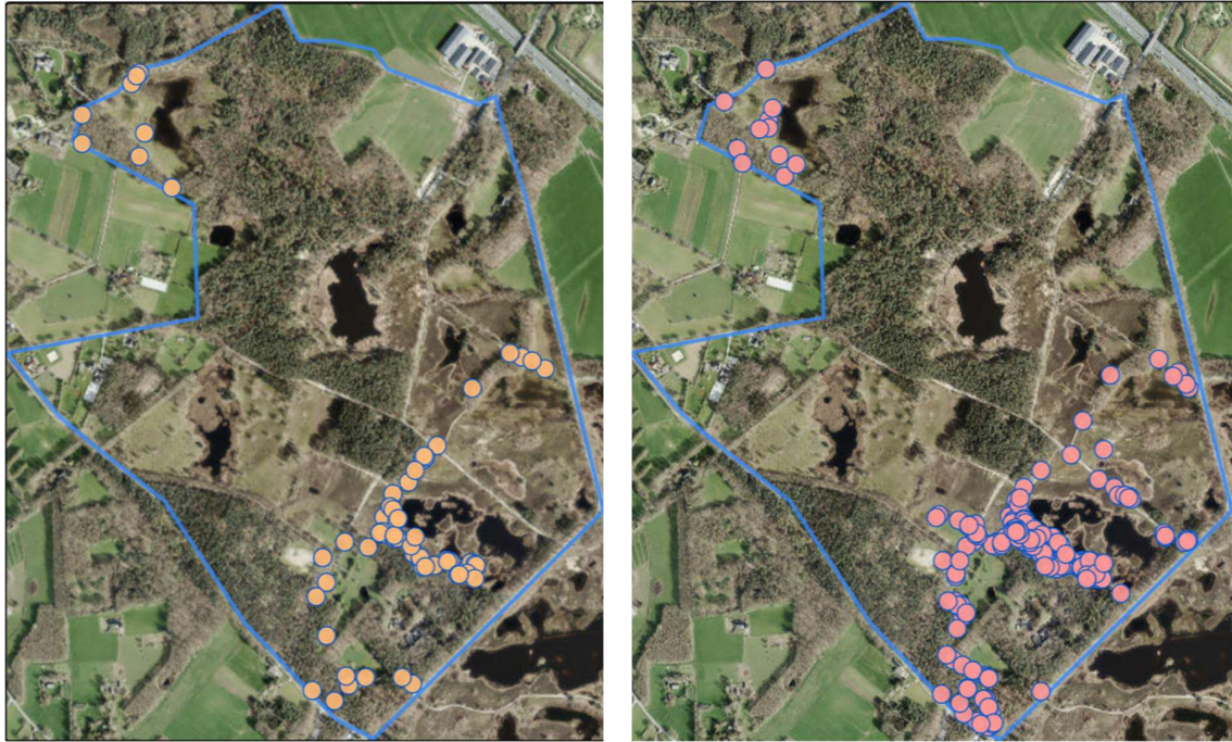
Figuur 5. Waarnemingen dagvlinders (links) en nachtvinders (rechts) in 2024 van de auteur.