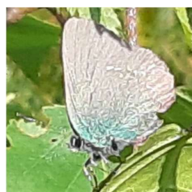
Groentje, 18 mei 2024